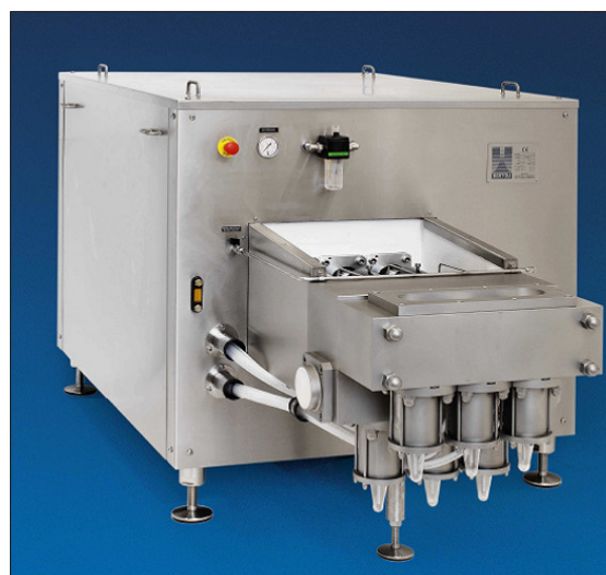
Dargestellt Typ X-3011 3 Kolben, max. 11,00 kW