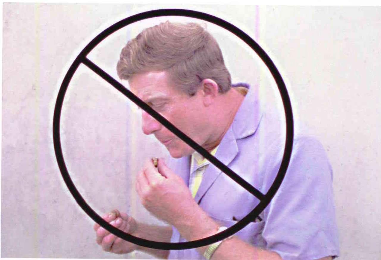
NICHT PUSTEN - auch nicht mit Druckluft