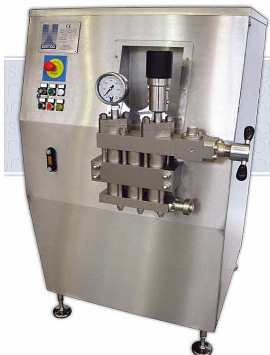
Dargestellt Typ HA -31011 Michaelangelo 3 Kolben